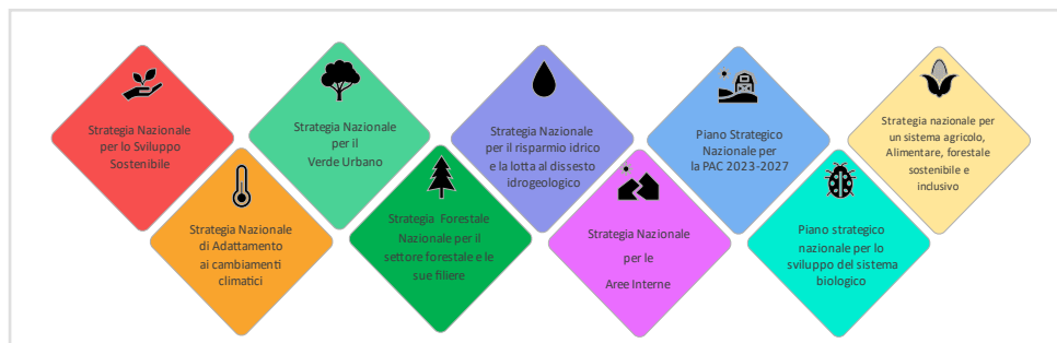
Figura 1: Principali altri strumenti strategici nazionali ai quali la SNB si integra

Agli Ambiti di intervento si associano i “ Vettori ”, ambiti trasversali di azione che possono facilitare, rafforzare e concorrere al raggiungimento degli obiettivi della SNB 2030 (Fig.3).