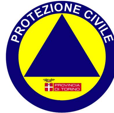
PIANO DI PROTEZ. CIVILE DI BACINO