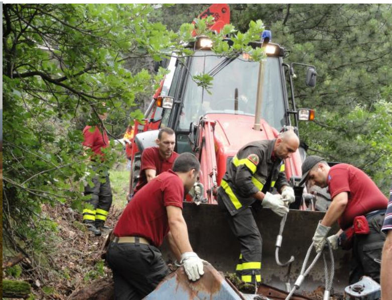
PROGETTI DI RIQUALIFICAZIONE (FONDI CORONA VERDE – FESR E ACCORDO CON VVF)